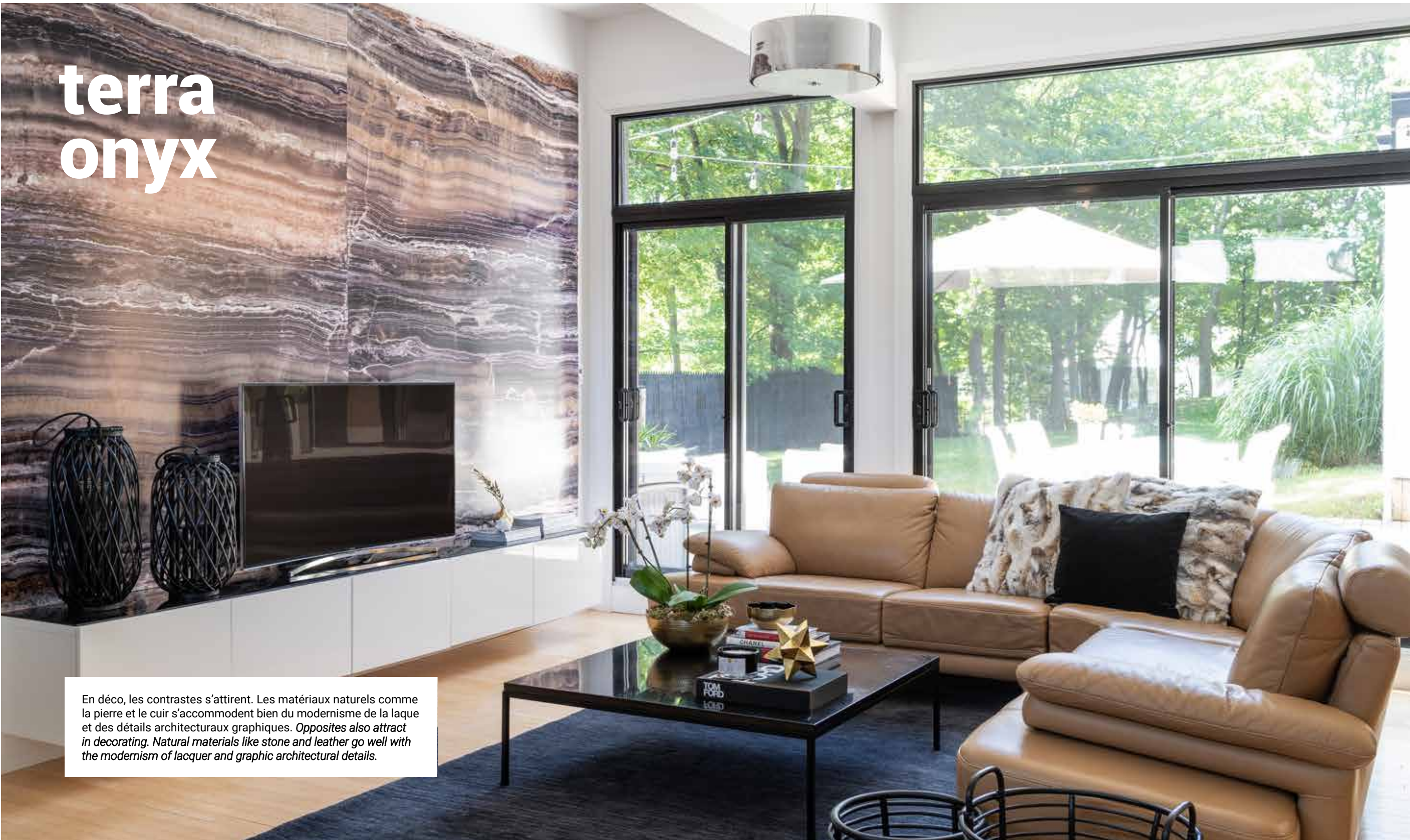
En déco, les contrastes s'attirent. Les matériaux naturels comme la pierre et le cuir s'accrochent bien du modernisme de la laque et des détails architecturaux graphiques. Opposites also attract in decorating. Natural materials like stone and leather go well with the modernism of lacquer and graphic architectural details.