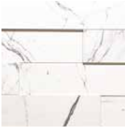
duo atrium 6

Plus de 50 produits différents sont disponibles : rendez-vous au murdesign.ca pour admirer nos collections! More than 50 different products are available. Go to murdesign.ca to check out our collections!