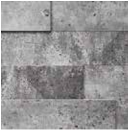
duo béton 6