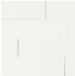
duo blanc 6